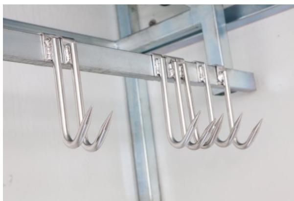
Fot. nr 3 Haki boczne