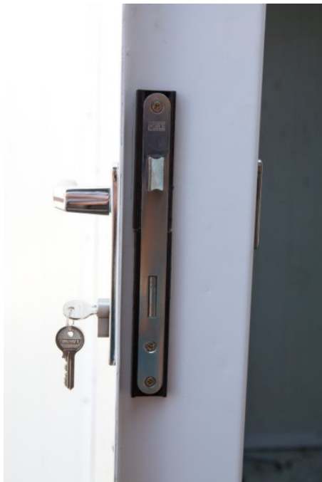
Fot. nr 5 Zamek drzwi zewnętrznych