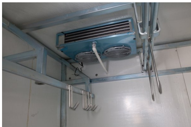
Fot. nr 1 Prowadnica centralna, agregat i haki boczne

Drzwi zewnętrzne i wewnętrzne wykonane z płyty warstwowej wyposażone w zamek Gerda (Fot. nr 5).