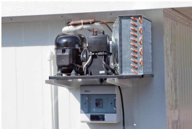
Fot. nr 4 Agregat z chłodniczką