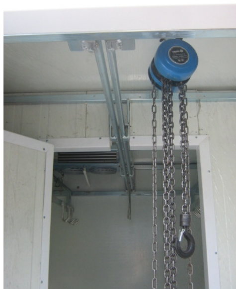
Fot. nr 2 Wciągarka łańcuchowa